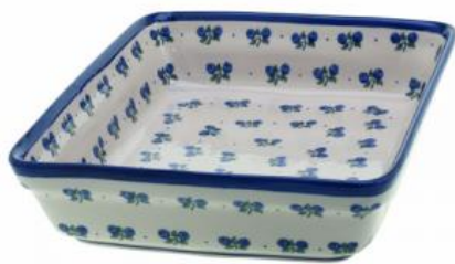
11-13 Zapiekacz prostokątny H=6,8cm, 26x31,5cm