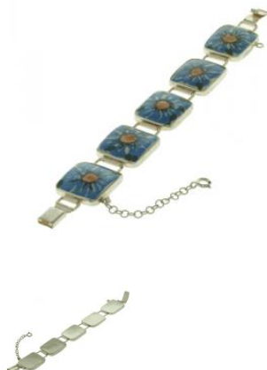
14-33 Bransoletka w srebrze L=20cm