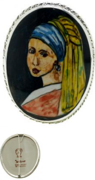
14-71 Broszka L=7,7cmx6cm