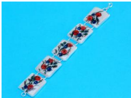
14-30 Bransoletka w srebrze L=21cm