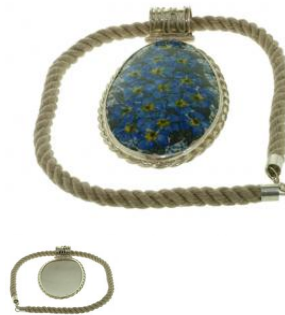
14-73 Zawieszka duża L=11cmx7cm