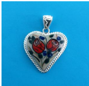
14-24 Wisiorek serduszeko w srebrze L=4,7cmx4,5cm