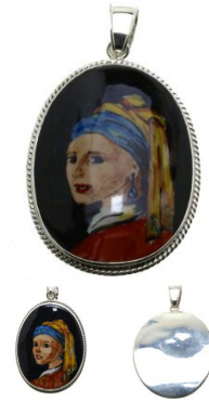
14-70 Zawieszka duża L=7,7cmx6cm