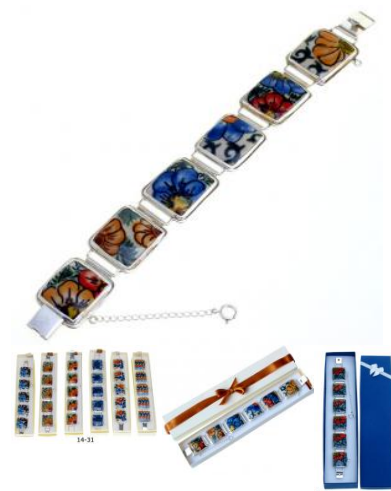
14-31 Bransoletka w srebrze L=23cm