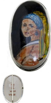
14-72 Klamra do paska L=9cmx5cm