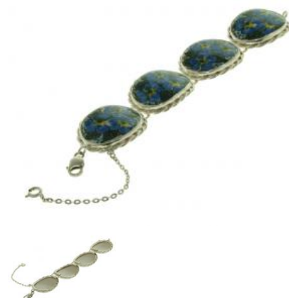
14-34 Bransoletka w srebrze L=20cm