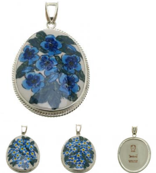
14-74 Zawieszka duża L=8cmx6cm