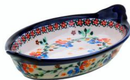
12-11 Półmisek owalny H=3,2cm, 13x23,5cm