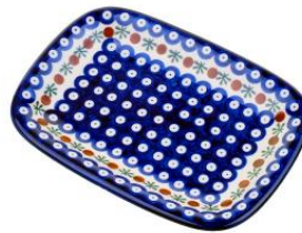
12-03 Półmisek płytki 17,5x24,5cm