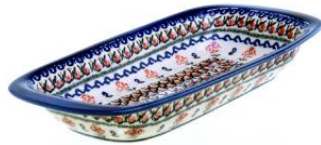
12-02 Półmisek głęboki 18x32cm