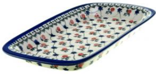
12-01 Półmisek płytki 18x32cm