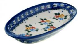
12-14 Półmisek owalny H=2,2cm, 7,3x14,5cm