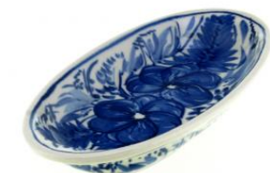
12-15 Półmisek owalny H=2,2cm, 9x16,5cm