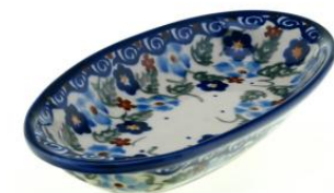
12-16 Półmisek owalny H=2,7cm, 9,2x18,2cm