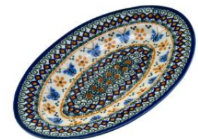
12-21 Półmisek owalny H=2,6cm, 17x24cm